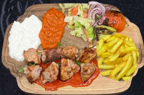
SOUVLAKI FLÄSKFILÉ 209:- Marinerade grillspett av fläskfilé serveras med tzatziki, muhamara och tomatsås