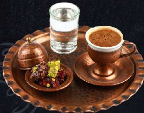
Turkisk kaffe 89:-