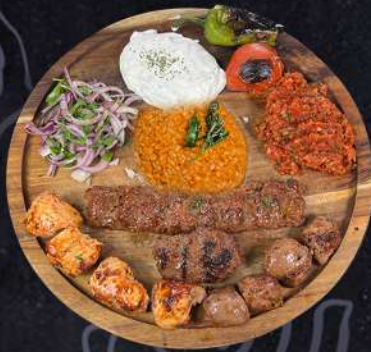
GAMLA STAN SPECIAL 279:- Lammspett, kycklingspett, blandat nöt- och lammfarsspett, nötfarsbiff