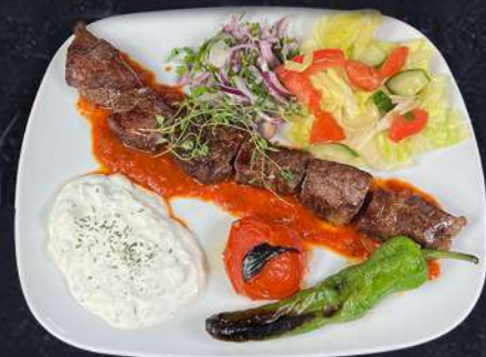
SOUVLAKI ENTRECÔTE 229:- Marinerade entrecôte i vitlök och oregano serveras med tzatziki och tomatsås