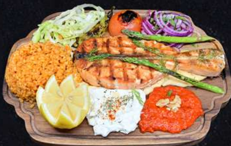
LAXFILÉ 259:- Laxfile grillas med citronpeppar grillad tomat, paprika, smakkryddad ralök persilja, citron