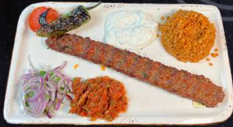
ADANA 250 gr 189:- (stark) Blandat nöt- & lammfarsspett

VÄLJ MELLAN POMMES , STEAKT POTATIS ELLER BULGUR