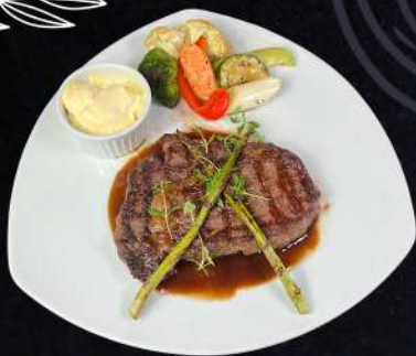
RIBEY STEAK 289:- Grillade Entrecôte med sparris, timjan, grillade grönsaker välja gärna en sås eller flera