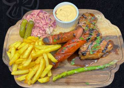
SPECIAL MIX 219:- Grillade Revben , grillkorv och chorizo korv, Coleslaw sallad, salt gurka, sparris , senapsås (sesamfrön)