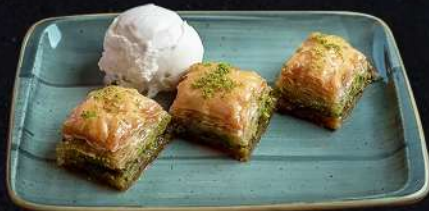
BAKLAVA MED GLASS 99:- Tusenbladsdeg med pistagefyllning.