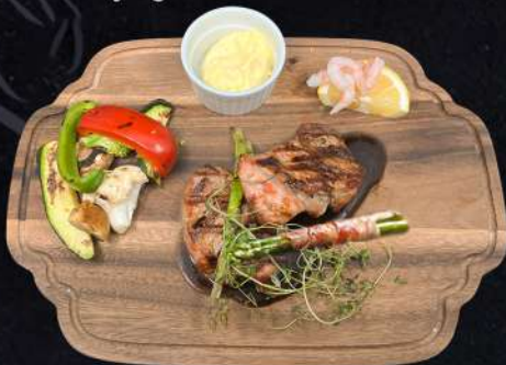
FILE OSCAR 249:- Grillade Fläskfilé med räkor, sparris, bacon, dil, citron, timjan, grillade grönsaker välja gärna en sås eller flera