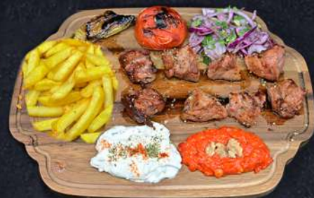
LAMMSPETT 259:- Marinerade grillspett av Lammytterfilé serveras med tzatziki, muhamara och tomatsås

VÄLJ MELLAN POMMES , STEAKT POTATIS ELLER BULGUR