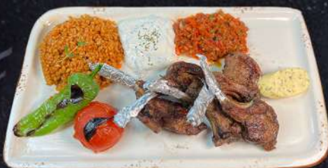
LAMMRACKS 299:- Lammracks grillas och serveras med vitlökssmör och rödvinsås