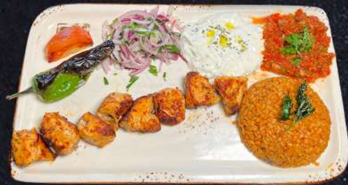
KYCLINGSPETT 179:- Marinerade kycklingfiléserveras med tzatziki, muhamara och tomatsås