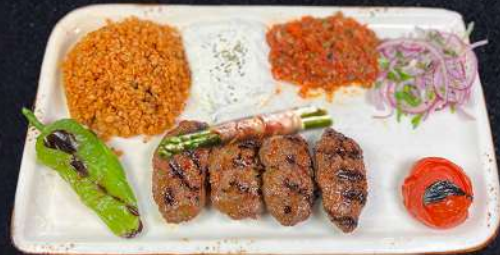
LJUSDAL SPECIAL 209:- Kolgrillade nötfärsbiffar med grillad bacon, sparis & tomatsås