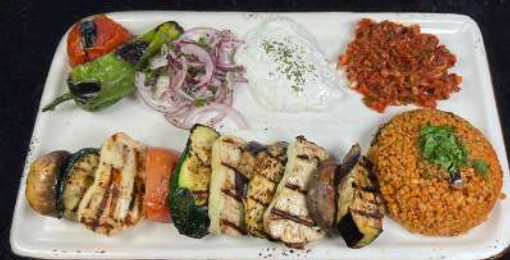
HALLOUMMISPETT 199:- VEGETARISK

VÄLJ MELLAN POMMES , STEAKT POTATIS ELLER BULGUR