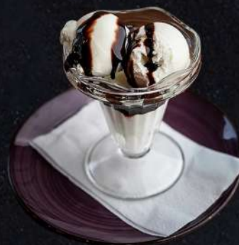
GLASS MED TOPPING 69:-