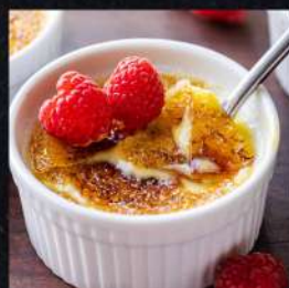
CREAM BRULÉE 99:-