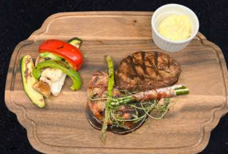
BLACK AND WHITE 279:- Grillade Fläskfilé och Oxfilé med sparris, bacon, timjan, dil, grillade grönsaker välja gärna en sås eller flera