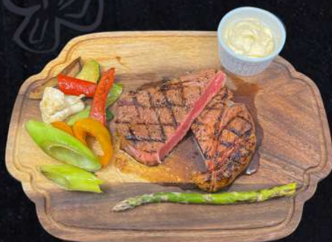
NEW YORK STEAK 319:- Grillade Ryggbif med sparris, timjan, grillade grönsaker välja gärna en sås eller flera