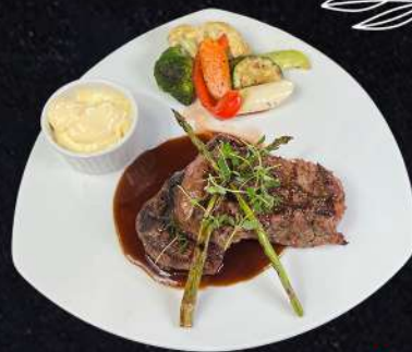
TENDERLOIN OXFILÉ 329:- Grillade Oxfilé med sparris, timjan, grillade grönsaker välja gärna en sås eller flera