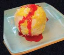
TARTUFO LIMONCELO 69:-