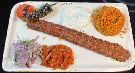
ADANA 250G 169:- (stark) Blandat nöt- & lammfarsspett