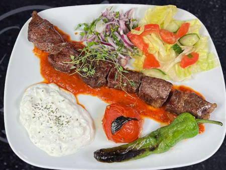
SOUVLAKI ENTRECÔTE 199:- Marinerade entrecôte i vitlök och oregano serveras med tzatziki och tomatsås