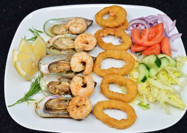
HAVETS MIXTALLRIK 169:- Gröna musslor, calamari & jumboscampi med tzatziki & grönsaker