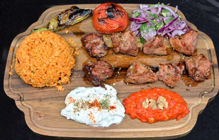
LAMMSPETT 219:- Marinerade lammfilespett grillad tomat,paprika, smakkryddad ralök persilja