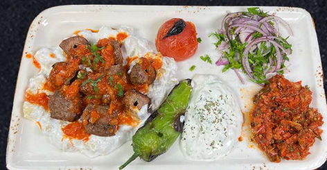
ALI NAZIK KUZU SIS 229:- Lammfilespett pa badd av aubergineröra