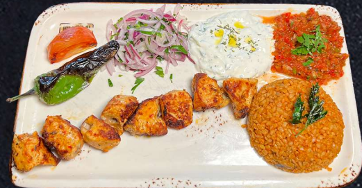
TAVUK SIS 169:- Marinerade kycklingspett