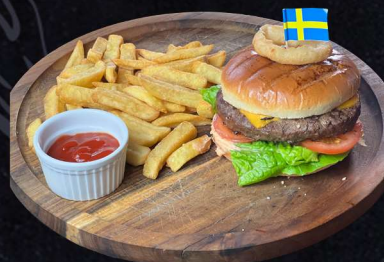
HÖGREVSBURGARE 169:- Med cheddarost, lökringar sallad och pomes