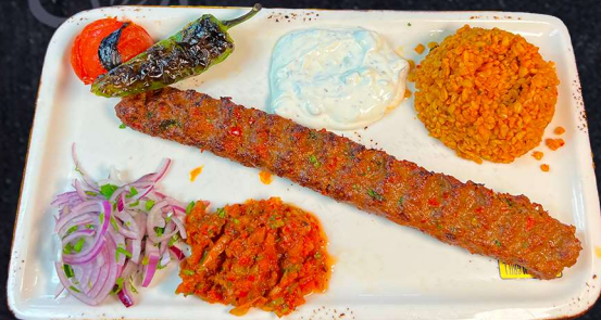
NÖTSPETT 169:- Nötfarsspett