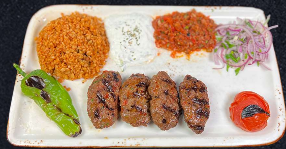
IZGARA KÖFTE 169:- Kolgrillade nötfarsbiffar