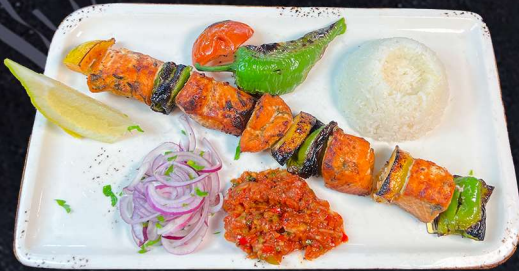
LAXPETT 169:- Serveras med citron, grillad tomat, paprika