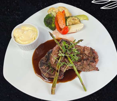
BON FILE 289:- Oxfile grillad serveras med rödvinssås & bearnaise grönpepparsås