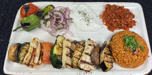
HALLOUMMISPETT 169:- VEGETARISK