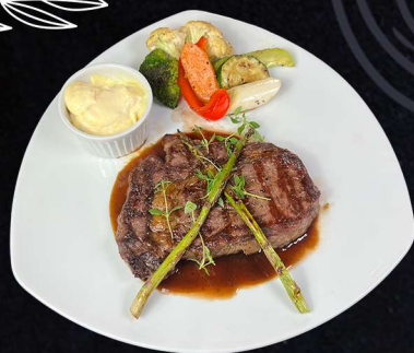
GRILLAD ENTRECÔT 259:- Entrecôte serveras med rödvinssås och vitlökssmör