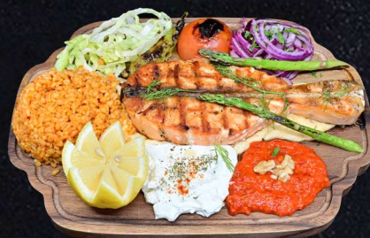
LAXFILE 219:- Laxfile grillas med citronpeppar grillad tomat, paprika, smakkryddad rälok persilja, citron