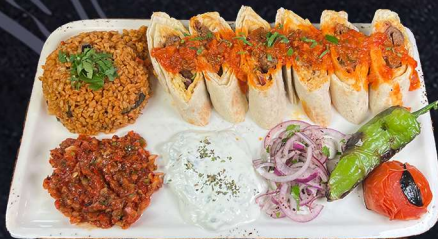
BEYTI 199:- Nöt- & lammfarsspett , tunnbröd, toppat med tomatasas