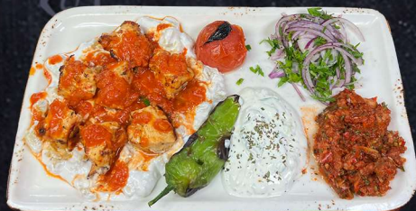
ALI NAZIK TAVUK SIS 189:- Kycklingspett pa badd av aubergineröra