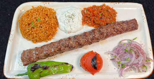
URFA 250G 169:- Blandat nöt- och lammfarsspett