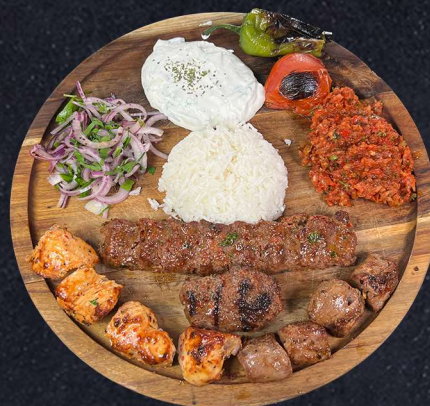
GAMLA STAN SPECIAL 239:- Lammspett, kycklingspett, blandat nöt- och lammfarsspett, nötfarsbiff