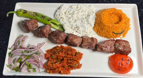
OXFILESPETT 229:- Marinerade oxfile, grillad tomat, paprika, smakkryddad ralök, persilja