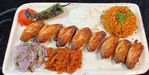
KANAT 169:- Marinerade Kycklingvingar