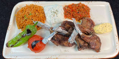
LAMMRACKS 259:- Lammrack grillas och serveras med vitlöksmör och rödvinsås